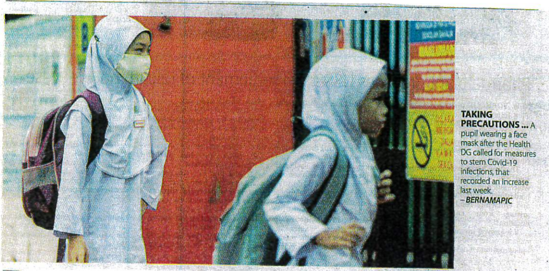
TAKING PRECAUTIONS ... A pupil wearing a face mask after the Health DG called for measures to stem Covid-19 infections, that recorded an increase last week.