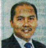
Timbalan Pengarah, Pusat Keplimpinan dan Kompetensi, Universiti Tun Hussein Onn Malaysia

Menjelang 2030 , Malaysia akan mencapai status negara tua apabila penduduk berusia 60 tahun ke atas mencapai 15 peratus daripada jumlah penduduk.