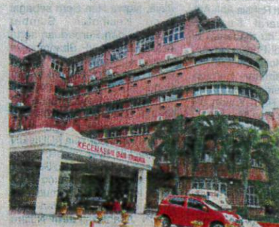
Perkhidmatan perubatan di HSA, Johor Bahru juga berjalan lancar.

Berdasarkan pemerhatian, kesemua unit perkhidmatan kesihatan di hospital berkenaan