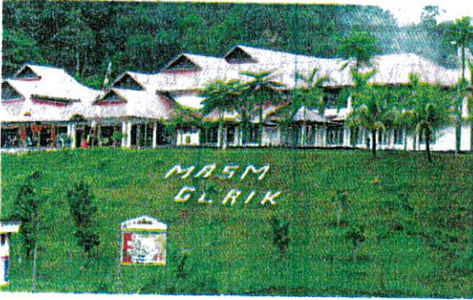
SEBAHAGIAN pelajar mengalami keracunan makanan di MRSM Gerik pada Ahad lalu. - GAMBAR HIASAN

AKHBAR : KOSMO MUKA SURAT : 17 RUANGAN : NEGARA