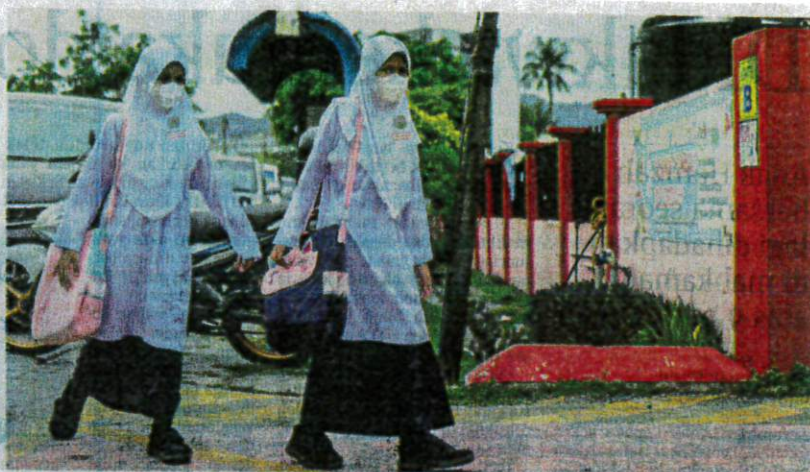
Murid memakai pelitup muka bagi mengekang penularan COVID-19 yang kembali meningkat dalam kalangan pelajar sekolah.

Peningkatan kes dan kluster COVID-19 itu berlaku berikutan