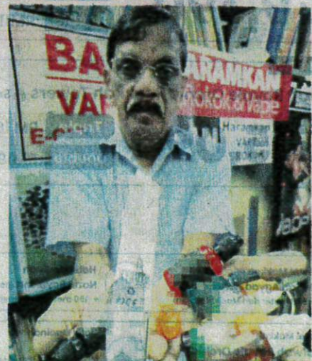
Subbarow menunjukkan vape yang mengandungi nikotin yang bebas dijual di pasaran.

Beliau berkata, bukan sahaja pelajar sekolah, peratusan pelajar institut pengajian tinggi yang merokok dan menghisap vape juga membimbangkan.