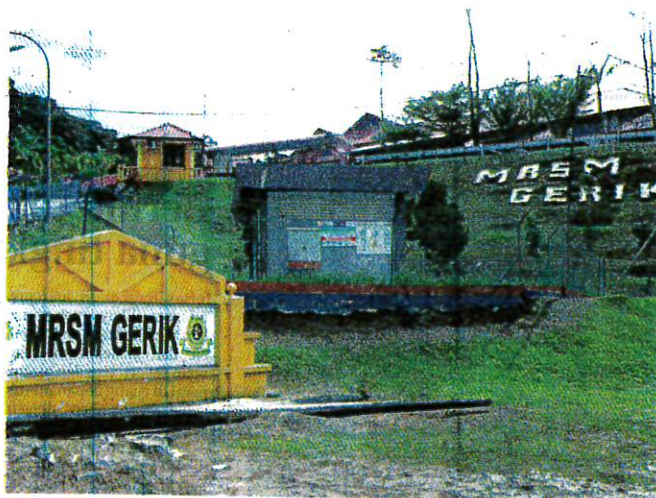
SURAMAI 60 pelajar MRSM Gerik mengalami gejala sakit perut, cirit-birit, muntah dan sakit kepala sebelum kesemuanya dirawat sebagai pesakit luar.

"Onset terawal dilaporkan pada jam 8 malam hari yang sama (Ahad) dan onset terakhir adalah pada jam 7 pagi keesokannya," katanya pada sidang media di pejabatnya di Bangunan Perak Darul Ridzuan di sini, semalam.