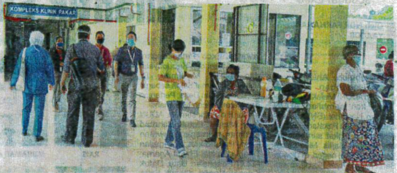
Operasi perkhidmatan kesihatan di HRPB, Ipoh berjalan seperti biasa pada Rabu.

"Tidak ada mogok dilakukan mereka (doktor kontrak) termasuklah mengambil cuti sakit atau kecemasan," katanya ketika