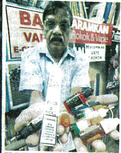
SUBBARROW menunjukkan produk cecair vape.

CAP utarakan kegusaran ibu bapa ekoran keputusan keluaran nikotin daripada senarai racun